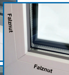
*Falznut der Glasleiste